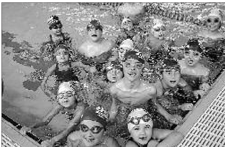
Los prebenjamines tienen un gran futuro.