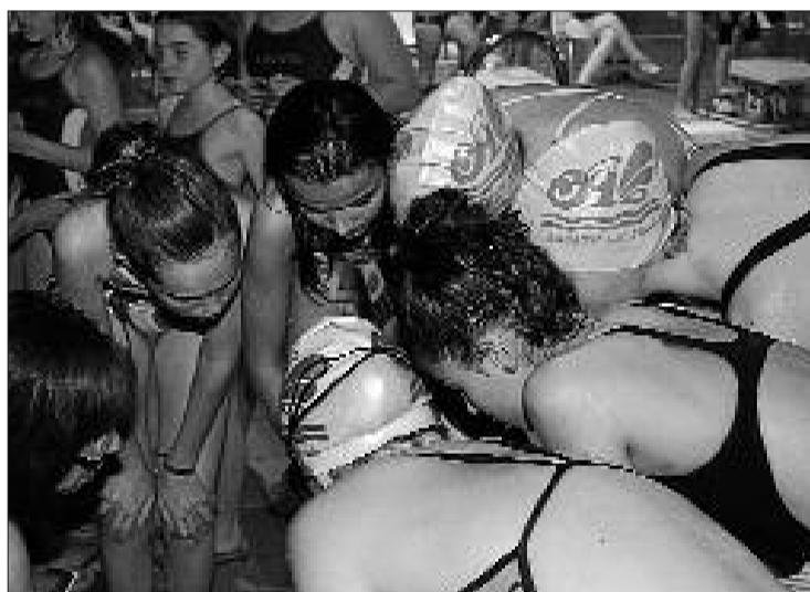
Los nadadores del Aquàtic estuvieron muy concentrados.